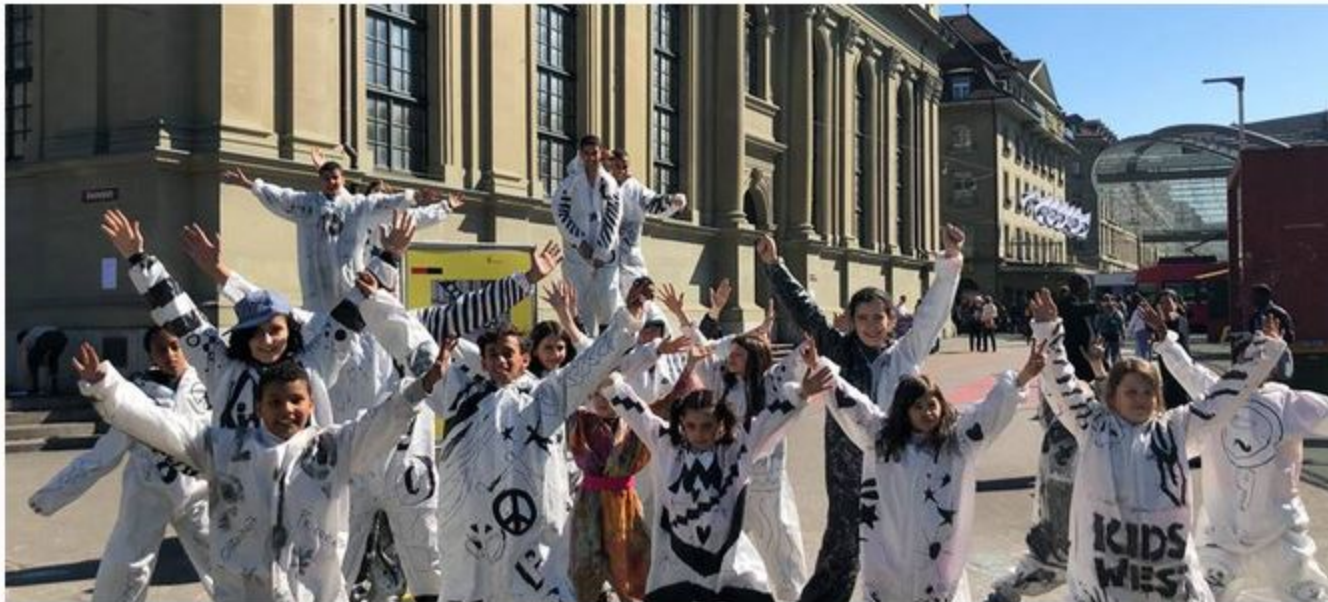
Eine Aktion im Rahmen der neunten Aktionswoche gegen Rassismus vom Projekt Kidswest.