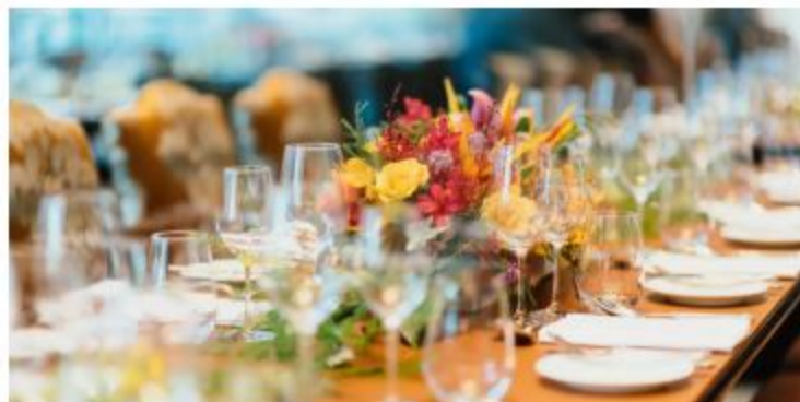
Fest (Symbolbild)

Seit zehn Jahren organisiert die Stadt Bern die Aktionswoche gegen Rassismus. Am Freitag, 21. Februar, startet die Kampagne zur 10. Aktionswoche.