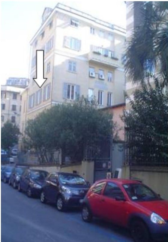
Ansicht von unten (Via Felice Romani). Der Pfeil bezeichnet Raum 5 (Atelier). Eingang zum Innenhof.

Die beiden Ateliers der SKK sind sehr zentral gelegen. Knapp zehn Gehminuten vom Bahnhof Brignole und von der Shoppingzone entfernt. Sie befinden sich im Gebäude der Unione Elvetica (Baujahr 1890). Im 1. Stock (primo piano) sind zwei Ateliers, sowie zwei Wohnräume von ca. 20m 2 , eine Kochnische (2 Herdplatten) und einem kleinen Badezimmer (Dusche und Lavabo) eingerichtet worden. Die Ateliers sind hell und geräumig. Das kleinere verfügt über einen direkten Wasseranschluss und soll eher der bildenden Kunst dienen.