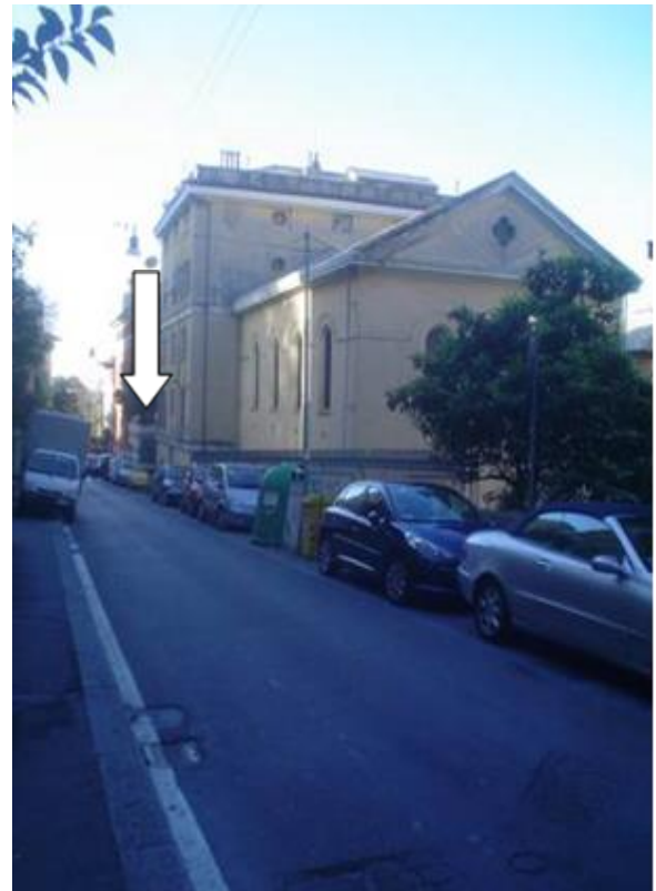
Ansicht von oberhalb. Die Via Peschiera steigt Richtung BetrachterIn auf. Der Pfeil bezeichnet den Eingang. Im Vordergrund die Kirche über den Räumen 1, 2, 3 und 4.