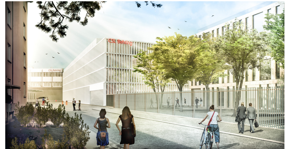
Abb. 2: Visualisierung Bauprojekt GBZ

Die Überbauung Verwaltungszentrum Guisanplatz 1 sieht zwischen den sich im Bau befindlichen Bauten Guisanplatz 1a und 1b die Schaffung eines zentralen, städtischen Platzes vor. Dieser Platz wird auf seiner Westseite durch das Logistikgebäude (GBZ) der CSL Behring derzeit städteräumlich nicht zufriedenstellend begrenzt. Mit der Ummantelung und der Einhausung der Rangierfläche des GBZ wird der Durchgang gegen Westen zur Wankdorfstrasse analog der übrigen Zwischenräume definiert und der neue Platz räumlich und architektonisch gefasst. Die westliche Gebäudekante des Projekts liegt auf einer Linie mit dem im Projektwettbewerb „Urbane Aussenraumgestaltung Verwaltungszentrum Guisanplatz 1 Bern“ (2012) vorgeschlagenen Arealbegrenzung. In diesem Sinne ermöglicht die geplante Gebäudeecke einen städtebaulich stimmigen Abschluss des Gesamtareals.