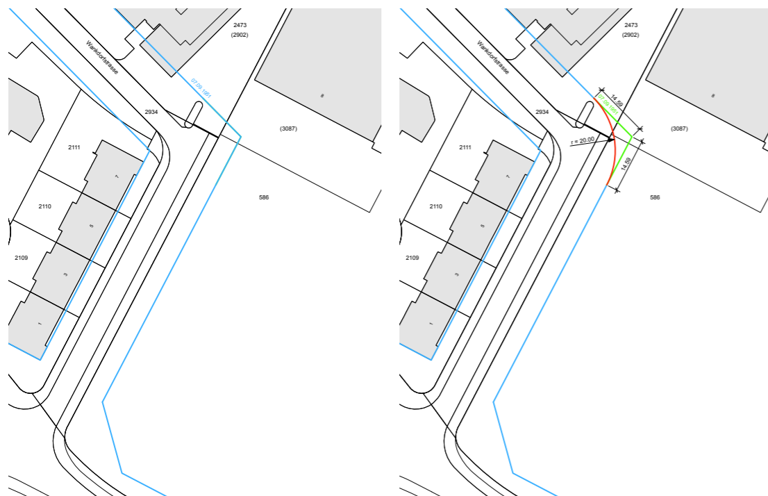
Abb. 5: Projektierte Baulinie an der Ecke Wankdorfstrasse 8 (blaue Linien = Baulinien genehmigt)

Mit dieser Änderung erfolgt eine optimale Integration des Gebäudes GBZ Etappe 1 in die Überbauung „Verwaltungszentrum Guisanplatz 1“ des Bundes und es wird gleichzeitig eine Verbesserung der städtebaulichen Situation sowie eine Minderung der Lärmbelastung für das Quartier erreicht.