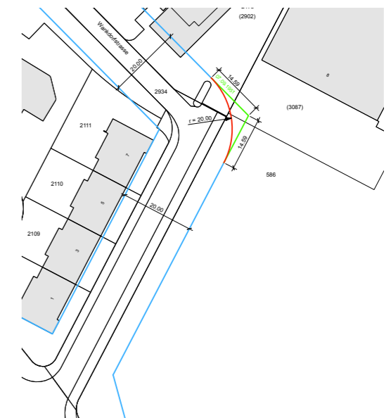
Abb. 4: Sicherung Strassenraum von 20m mit Baulinien (blaue Linien = Baulinien genehmigt, rote Linie = neu abgerundete Baulinie, grüne Linie = aufgehobene Baulinie)