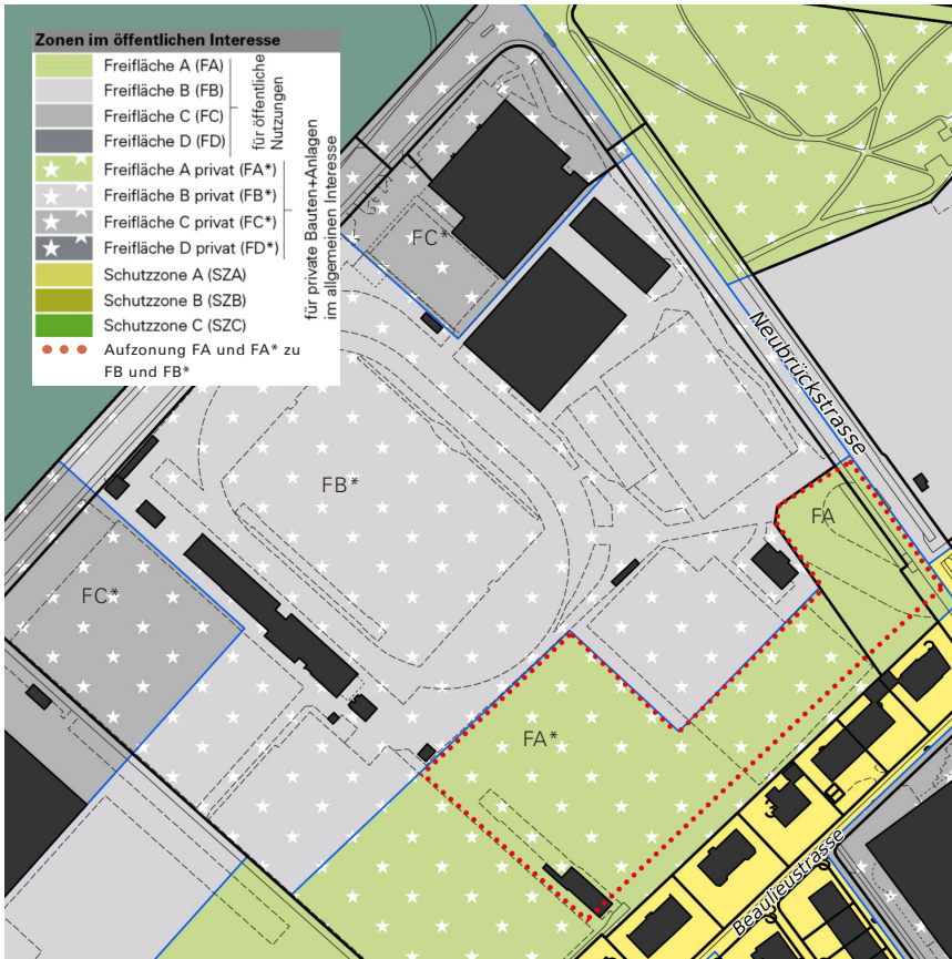
Zonenplan mit Wirkungsbereich Aufzoning FA und FA* zu FB und FB*