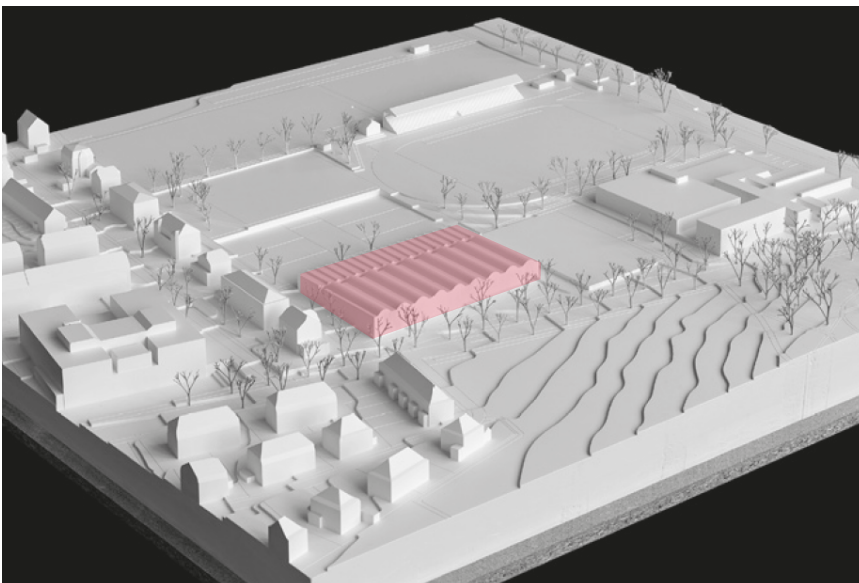
Modellfoto Siegerprojekt „goccia“; Quelle: Armon Semadeni Architekten GmbH

Das heutige Clubhaus des Tennisclub Neufeld wurde aus dem Bauinventar entlassen. Es wird im Bauprojekt zur Schwimmhalle geprüft, ob das Clubhaus andernorts wieder aufgebaut werden kann. Die bestehende, temporäre Traglufthalle für den Tennissport kann innerhalb des Areals weiterhin aufgebaut werden.