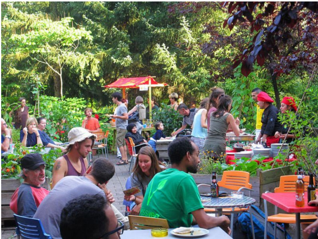
Abb. 3: https://www.lucify.ch/2018/09/09/neue-synergien-am-alten-zieglerspital/ , Jan. 2021

Über Quartierplätze eingangs des Areals und das daran anschliessende Wegnetz entsteht eine einladende Wirkung. Ein Teil der Erdgeschossnutzungen wird die bereits bestehenden Dienstleistungs- und Gewerbenutzungen in der Umgebung ergänzen. Die Quartierplätze und unterschiedlichen publikumsorientierten Nutzungen dienen als Anknüpfungspunkte für Bewohner*innen sowie für die Öffentlichkeit. Aneignungs- und Interaktionsmöglichkeiten stellen die Belebung des neuen Wohnquartiers sicher. Der historische Kern mit der Campagne Bellevue im Zentrum bietet Chancen, mittels Nutzungen wie Gastronomie und gemeinschaftlichen Räumlichkeiten ein Ort der Begegnung zu werden. Durch die topografische Erhöhung in diesem Teil des Areals profitiert das Quartier von einer äusserst attraktiven Aussicht auf die Berner Altstadt. Zur Vernetzung mit dem umliegenden Quartier sollen nach Möglichkeit bereits vorhandene Zwischennutzungen weitergeführt werden. Ergänzend werden neue Nutzungen u.a. auch mit bildungsorientierten und sozialen Angeboten von und für das Quartier etabliert. Dabei sind insbesondere soziale Angebote wie Kinderkrippe, Dienstleistungen und Treffpunkte mit nachbarschaftlich integrativer Wirkung anzustreben. Die gesamtheitliche gemeindeübergreifende Vernetzung mit dem nördlich gelegenen Morilongut verbindet den Stadtkörper und schafft damit einen urbanen Raum.