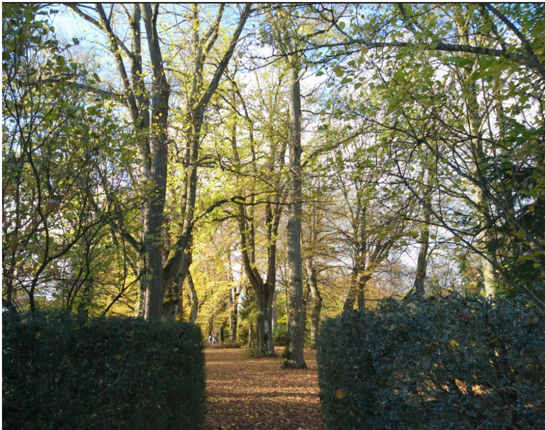
Abb. 5: Parkanlage Ziegler-Areal, Marco Aeschmann, Sept. 2017

Die am Fusse der geschützten Parkanlage liegende Campagne Bellevue bildet in diesem Ensemble den historischen Kern des Areals und ist als identitätsstiftendes Element besonders wertvoll und integral zu erhalten. Mit der Öffnung des Areals und öffentlicher Erschliessung der Parkanlage werden Nutzungsansprüche für Freizeit und Naherholung der künftigen Bewohner*innen und umliegenden Bevölkerung abgedeckt. Durch gezielte Planung der Durchwegung wird die Parkanlage an das Wegnetz angeschlossen und als wesentlicher Bestandteil des Wohnquartiers in Wert gesetzt. Die Kontraste zwischen Natur und Urbanität, zwischen topografisch erhöhter Parkanlage und belebtem urbanem Raum sind eine einzigartige Qualität und gelten als prägende Identität des neuen Wohnquartiers.