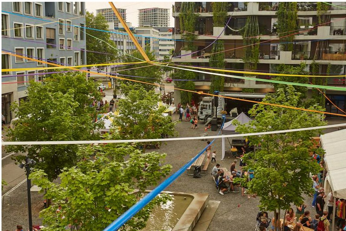
Abb. 4: Referenzbild: Hunziker Areal Zürich, https://tdlab.usys.ethz.ch/de/reallabore/hunziker.html , Jan. 2021

Das Wohnangebot soll verschiedene Zielgruppen ansprechen (z.B. verschiedenste Familienformen, junge Paare, ältere Menschen, Generationenprojekte, Atelierwohnen, Wohnungen für Menschen unterschiedlichen Alters, etc.). Preisgünstige Wohnungen werden das bestehende, klassisch ausgerichtete Wohnungsangebot der Umgebung ergänzen und innovative Wohnformen ermöglichen. In Übereinstimmung mit der Wohnstrategie der Stadt Bern sind marktergänzende, nachbarschafts- und gemeinschaftsorientierte Wohnangebote anzustreben. Die neuen Wohnungen führen zu einem zusätzlichen Schulraumbedarf. Dieser ist durch Schulinfrastruktur innerhalb des neuen Quartiers sicherzustellen. Neben dem Schwerpunkt Wohnbau ergänzen stilles Gewerbe, gemeinschaftliche und quartierorientierte Nutzungen, Dienstleistungsangebote sowie Schulinfrastruktur den Nutzungsmix und stellen damit einen vielfältigen und belebten Quartierteil sicher. Die Bauträgerschaften, darunter mindestens zu einem substantziellen Anteil der Fonds, sorgen für preisgünstigen und typologisch heterogenen Wohnraum sowie ergänzende Nutzungen an geeigneten Lagen.