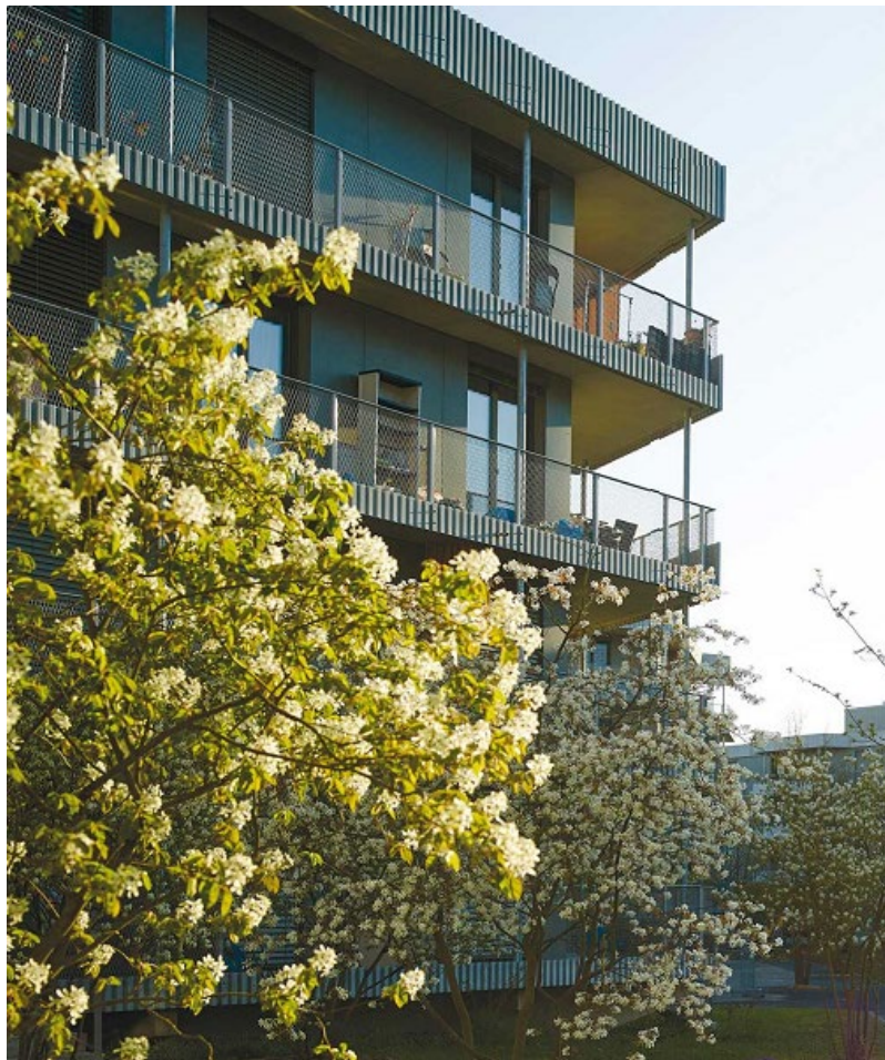
Abb. 2: Referenzbild, Stöckacker Süd, Foto Immobilien Stadt Bern, 2018

Das neue Wohnquartier soll als hochwertiger Wohn- und Lebensraum mit ansprechendem Nutzungsmix als verbindendes Element zwischen den Gemeinden Bern und Köniz wirken. Mit einladenden öffentlichen Räumen und einer attraktiven Nutzungsvielfalt vernetzt sich das neue Wohnquartier gezielt mit seiner Umgebung. Die Bautypologien stellen den Bezug zum reichhaltigen Grünraum im Zusammenspiel mit der Parkanlage her und machen das Quartier als attraktiven Standort sichtbar. Das Wohnquartier wird durch attraktive Architektur zu einem dichten, gut durchwegten Wohnstandort mit urbanem Charakter weiterentwickelt. Es ist beabsichtigt, das heutige Nutzungsmass zu erhöhen und damit eine nachhaltige Dichte als Beitrag zur Siedlungsentwicklung nach innen zu schaffen. Der sorgsame Umgang mit der Stadtsilhouette ist mittels einer verträglichen Höhenentwicklung sicherzustellen. Die angestrebte Verdichtung und Transformation des Bestands erfordern städtebaulich und architektonisch hochwertige Lösungen. Dies impliziert ein identitätsreiches und sinnstiftendes Nebeneinander von historischen Strukturen mit der zeitgenössischen Identität.