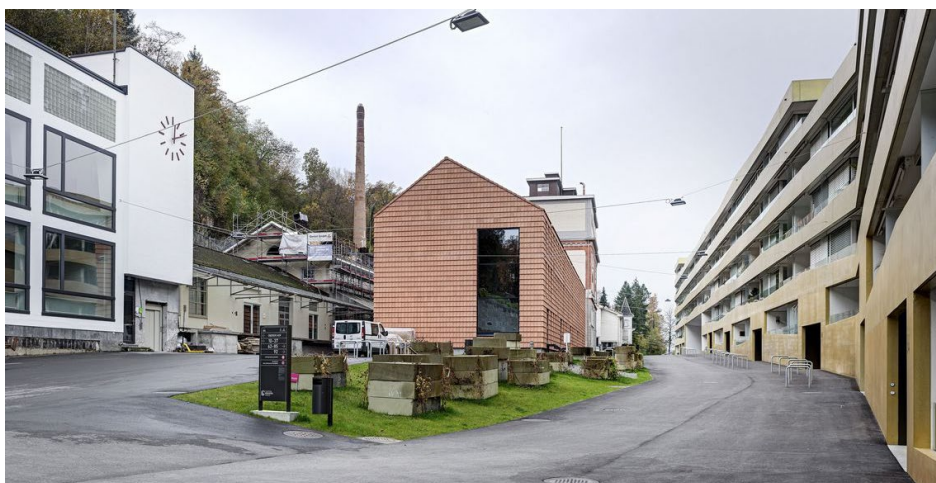
Abb. 1: Referenzbild: Gurten Brauerei Areal Bern, https://www.gurtenareal.ch/ , Jan. 2021

Die Begrünung, Materialisierung und Positionierung der Gebäude im Wohnquartier tragen positiv zu einem kühlenden Effekt in unmittelbarer und näherer Umgebung bei. Damit erfüllt das Wohnquartier eine wichtige stadtklimatische Funktion. Die bauliche Entwicklung des Areals soll durch in sich selbstständig funktionierende Etappen unter Berücksichtigung der gesamtheitlichen Betrachtung des Areals erfolgen. Den drei Nachhaltigkeitsdimensionen Gesellschaft, Wirtschaft und Umwelt wird dabei eine ausgewogene Gewichtung eingeräumt. Das Areal soll insbesondere im Hinblick auf die Erfüllung der Klimaziele aus dem städtischen Klimareglement entwickelt werden. Dabei kommt dem Absenkpfad der Treibhausgasemissionen, der Verminderung der grauen Emissionen und des grauen Energieverbrauchs eine zentrale Rolle zu.