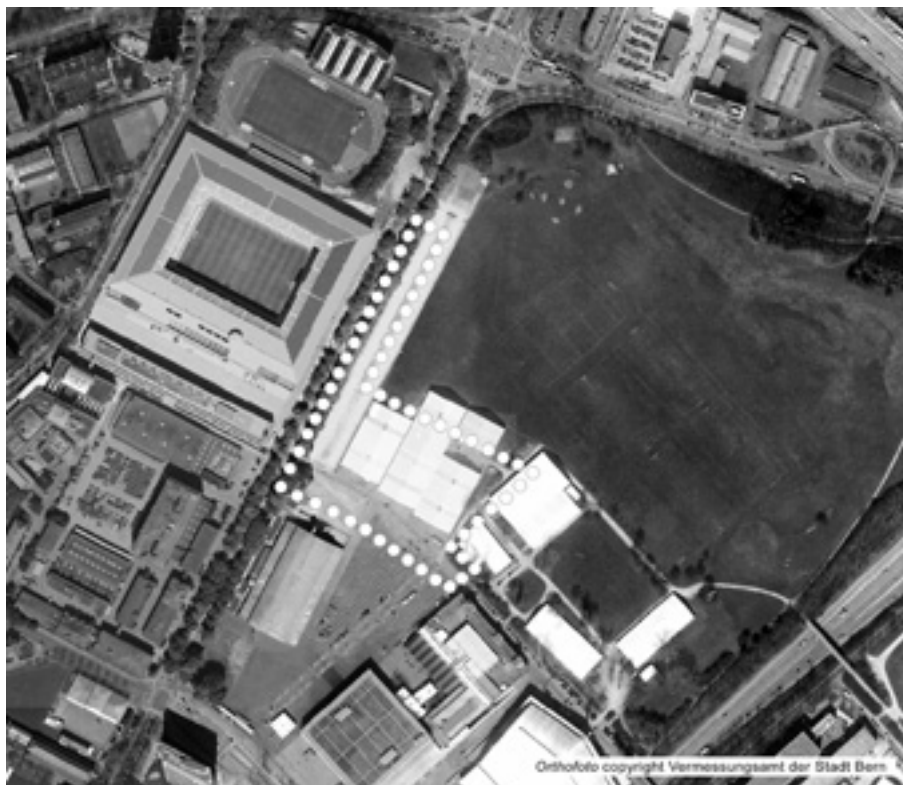
Das Planungsgebiet Grosse Allmend (innerhalb der punktierten Linie).