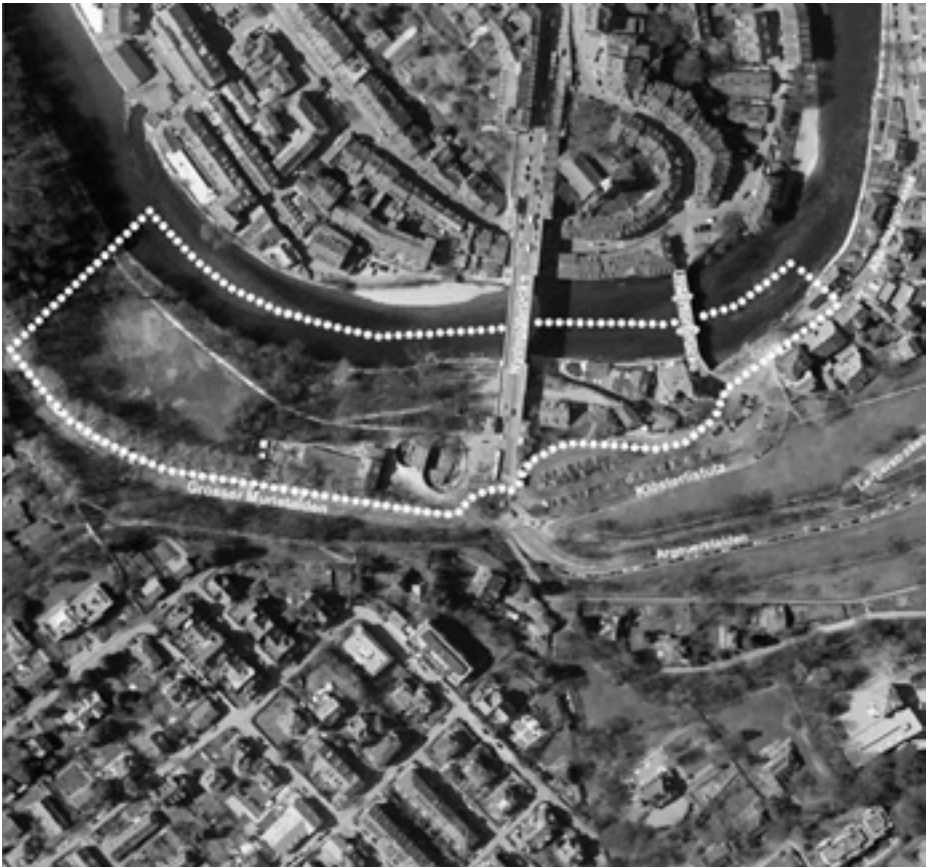
Das Planungsgebiet (innerhalb punktierter Linie)