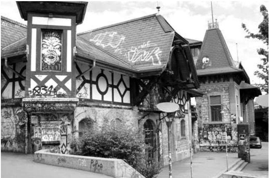
Gesamtansicht der Reitschule von der Neubrückstrasse