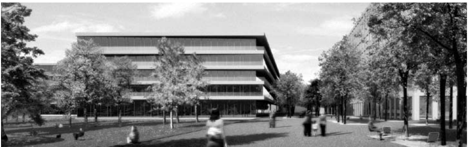
Die neue Wankdorfallee aus Osten (Fotomontage)

Der Fonds als Grundeigentümer wird die gesamte Aussenraumgestaltung finanzieren. Zur Koordination und Planung hat die städtische Liegenschaftsverwaltung eine externe Gesamtleitung beauftragt. In den kommenden Monaten soll die Siegerstudie optimiert und das Verkehrs- und Erschliessungskonzept, welches die sichere Koexistenz aller Verkehrsteilnehmenden unterstützt, überarbeitet werden. Mit der Realisierung soll parallel zum Baubeginn der übrigen Projektentwickler im Jahre 2011 begonnen werden. Das Projekt für den Aussenraum mitsamt Erschliessungsstrassen muss bis ins Jahr 2013 zur Hauptsache umgesetzt sein.