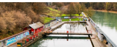
Sanierung Freibad Lorraine: Baukredit