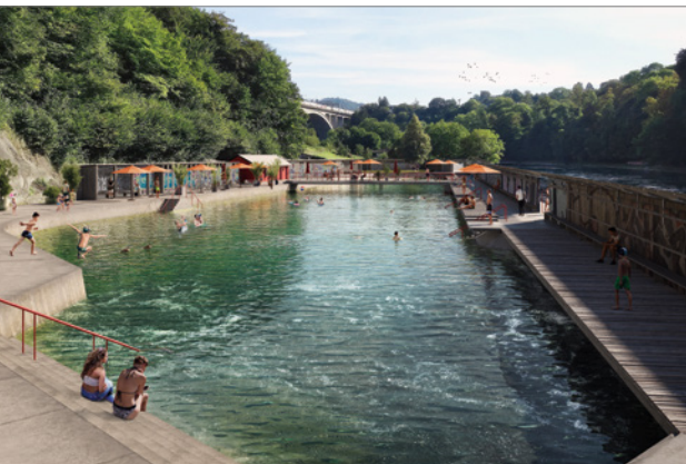
Das Bild zeigt das Freibad Lorraine nach der Sanierung. Neu wird das Schwimmbecken von der Aare durchströmt: Das Aarewasser fliesst unter dem Aaresteg hinein und am anderen Ende des Beckens wieder hinaus.

Der Kinderbereich auf der nördlichen Liegewiese wird umgestaltet. Das Planschbecken wird aufgehoben. Geplant sind stattdessen ein Spielbereich Sand und Wasserpumpe sowie eine