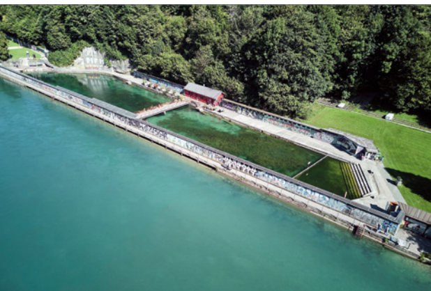
Das Freibad Lorraine wurde 1892 erbaut und seither nie umfassend saniert. Es umfasst ein Schwimmbecken, eine Buvette, einen Kinderspielplatz und mehrere Liegewiesen.

Durch den ungenügenden Wasseraustausch sowie durch die beiden Hochwasser 1999 und 2005 ist der Boden des Schwimmbeckens mit einer bis zu einem Meter dicken Schlamm- und