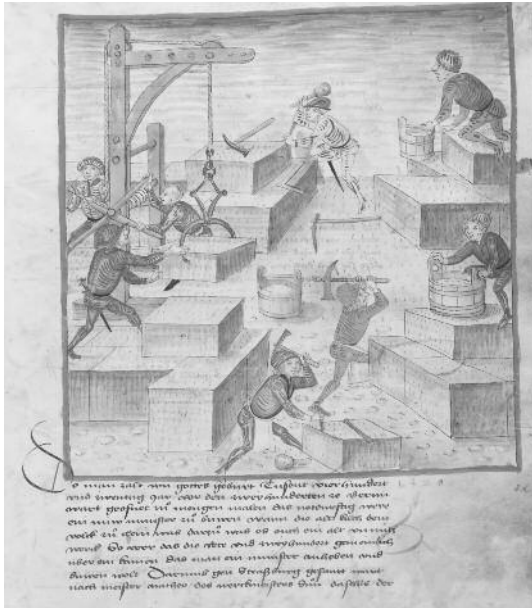
▲ «in dem iar nach der geburt xpi 1421 am 11. Tag maertze ward der erste stein geleit an dieser kilchen». Die Illustration der Grundsteinlegung des Münsters am 11. März 1421 in der Amtlichen Berner Chronik des Diebold Schilling 1478 bis 1483. (Burgerbibliothek Bern, Mss.h.h.I.1, Bd. 1, S. 451, publiziert in e-codices_bbb-Mss-hh-10001_451)

er in der Einleitung des Schuldbuchs selber festhält – insbesondere auch jährliche Zinse auf Häusern und Grundstücken, welche die Bevölkerung in Stadt und Land seit der Grundsteinlegung des Münsters 1421 an den Baubetrieb gestiftet hatten und sich Anfang 1448 noch im Besitz des heiligen Sant Vincencyen und der pfarrkilchen von Baern befanden.