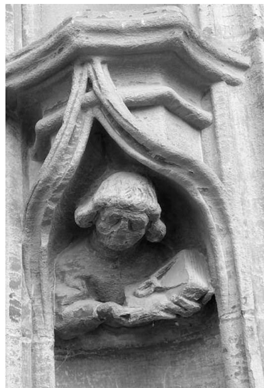
▲ Die Zeit hat ihre Spuren hinterlassen: Das um 1460 entstandene Porträt des ersten Münsterwerkmeisters Matthäus Ensinger im Gewände des südlichen Portals.

Nach Ausweis des im St. Vinzenzschuldbuch überlieferten Anstellungsvertrags hatte Matthäus Ensinger Anspruch auf Bargeld und Naturalien im Wert von jährlich rund 100 Gulden (dieser Betrag entsprach immerhin ungefähr dem Wert eines durchschnittlichen Wohnhauses in Bern). Sein Jahreslohn setzte sich zusammen aus je zehn Gulden alle drei Monate (40 Gulden), einem gefütterten Kleid (16 Gulden), einem Ochsen (5 Gulden), 20 Mütt Dinkel (ca. 11 Gulden) und sechs Saum «gutem» Landwein (8 Gulden). Dazu kamen für jede