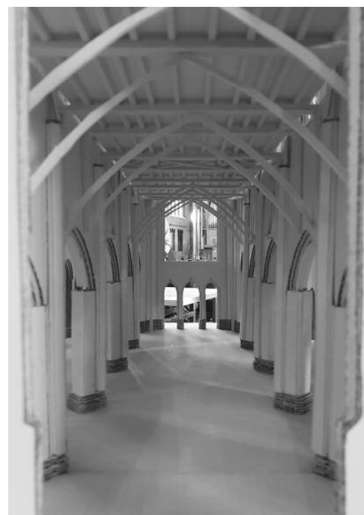
▲ Im Schnitt-Modell des Berner Münsters ist die auf Stützbögen gelagerte Balkendecke über dem Kirchenraum gut zu erkennen. Auf der Holzdecke werden die RestauratorInnen auf Rollgerüsten arbeiten, so wie sie das bereits bei der Restaurierung des Chorgewölbes getan hatten.