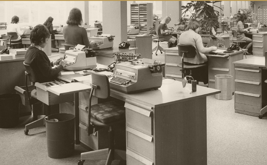
Die Mitarbeiterinnen und Mitarbeiter des Strassenverkehrsamts Bern arbeiteten um 1972 im Grossraumbüro.

Firmen und Verwaltungen mit vielen Mitarbeitenden schufen in den 1960er-Jahren Grossraumbüros. Die Büroangestellten standen nun nicht mehr unter der unmittelbaren Kontrolle des Vorgesetzten, sondern viel mehr unter gegenseitiger Beobachtung. Zimmerpflanzen, eine angenehme Beleuchtung und Akustik sollten für mehr Wohlbefinden in der bislang unpersönlichen Atmosphäre sorgen.