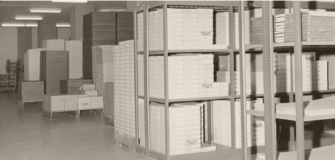
Da war Recyclingpapier noch kein Thema. Blick ins Papierlager der Schul- und Büromaterialverwaltung, 1970.

Nach der Umbenennung in Schul- und Büromaterialzentrale (SBZ) 1985 regelt die Stadt Bern die Beschaffung von Unterrichts- und Büromaterial sowie Reinigungsmittel neu. Zugleich stellte der Gemeinderat der Geschäftsleitung drei Fachkommissionen beratend zur Seite. Diese überprüften den bestehenden Büromaterialkatalog erstmals auch auf ökologische Kriterien. Dabei stellten sie fest, dass das Sortiment der Schul- und Büromaterialzentrale in vielen Teilen nicht den Anforderungen der Zeit entsprach.