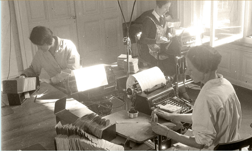
Für Frauen eröffnete der steigende Bedarf an Büroarbeitskräften neue Arbeitsmöglichkeiten. Im Bild Sekretärinnen der Postdirektion in Bern, 1933.

Die Industrialisierung und der Ausbau der öffentlichen Verwaltung nach 1900 brachten auch einen Aufschwung der Büroarbeit. In den Städten wuchs die Bevölkerung rasch. Dies stellte die Verwaltung vor neue Herausforderungen. Der Ausbau der Infrastruktur wie Wasser- und Energieversorgung, der Bau von Strassen, Brücken und Schulen musste geplant und organisiert werden. Dazu benötigte die Stadtverwaltung eine wachsende Zahl an Angestellten, die in den Büros arbeiteten.