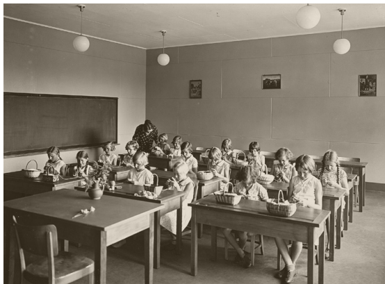
Der zentrale Einkauf brachte auch beim Material für den Handarbeitsunterricht Einsparungen. Im Bild eine Handarbeitsklasse aus dem Schulpavillon Elfenau, um 1933.