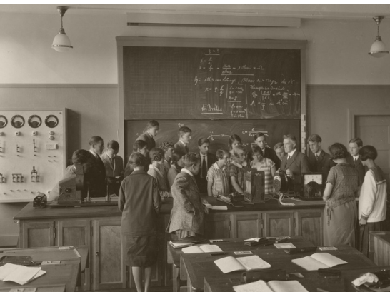
Ab 1925 kamen in den Berner Schulen genormte Hefte zum Einsatz. Im Bild eine Schulklasse aus dem Gymnasium Kirchenfeld, um 1926.

Die neue Amtsstelle setzte sich zum Ziel, Prozesse zu rationalisieren und Produkte zu standardisieren. Papierbogen waren damals in vielen unterschiedlichen Grössen in Gebrauch. Das deutsche Institut für Normung legte 1921 mit der DIN 476 die heute noch weltweit gebräuchlichen standardisierten Papierformate A4, A5 usw. fest. Diese Standardisierung in der Papierherstellung trug wesentlich zur Vermeidung von Ausschuss bei. Die SBV führte 1924 die standardisierten DIN-Formate ein und lobte die damit gewonnene Ordnung und die Einsparungen beim Lagerplatz.