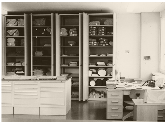
Die 1968 neu bezogenen Räume in Ausserholligen bieten mehr Lagerraum.