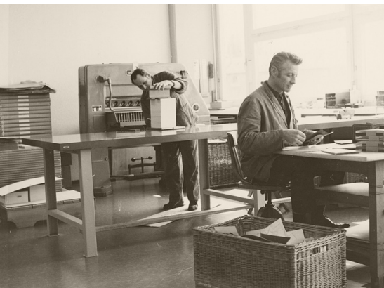
Zwei Mitarbeiter bereiten Drucksachen vor, 1970.

Die Einkaufspreise der SBV konnten mit den Billigangeboten aus dem Ausland immer weniger mithalten. Die in der Schweiz gestellten Qualitätsanforderungen und ein umständliches Warenverteilungsnetz führten zu einem grossen Preisgefälle zwischen in- und ausländischen Produkten. Bis anhin war die SBV gehalten, in der Schweiz einzukaufen. Um weiterhin möglichst günstige Waren für Schulen und Verwaltung zu beschaffen, unterstützte die SBV die von der Politik geforderte Einführung des «Freien Markts».