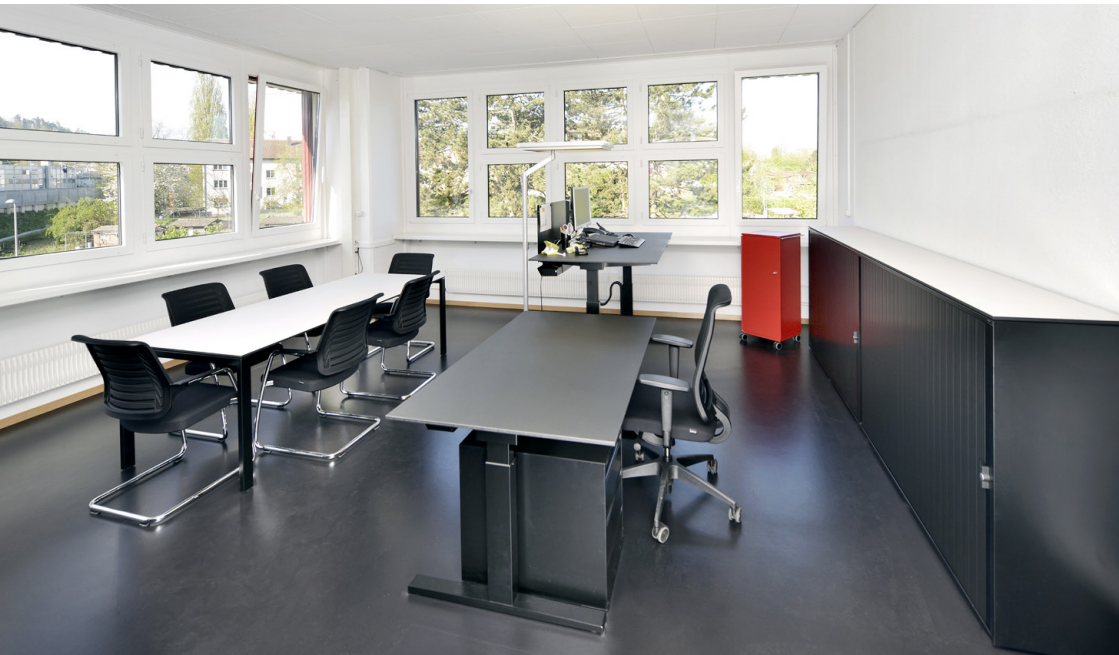
Standardmobiliar der Stadtverwaltung Bern

Das Hauptziel bleibt auch nach hundert Jahren noch das gleiche: durch Standardisierung und grössere Mengen zu günstigeren Preisen einkaufen. Gleichzeitig mit dem Namenswechsel führte die Stadtverwaltung ein neues Programm an Standardmobiliar ein. Bald soll es in den Stadtberner Amtsstuben nur noch einheitliches Mobiliar geben. Ob Büroangestellte/ oder «Stapi» lässt sich nicht mehr an der Büroausstattung ablesen.