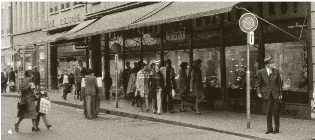
3 Am Loebegg 1957/58 4 Waaghausgasse, 1970