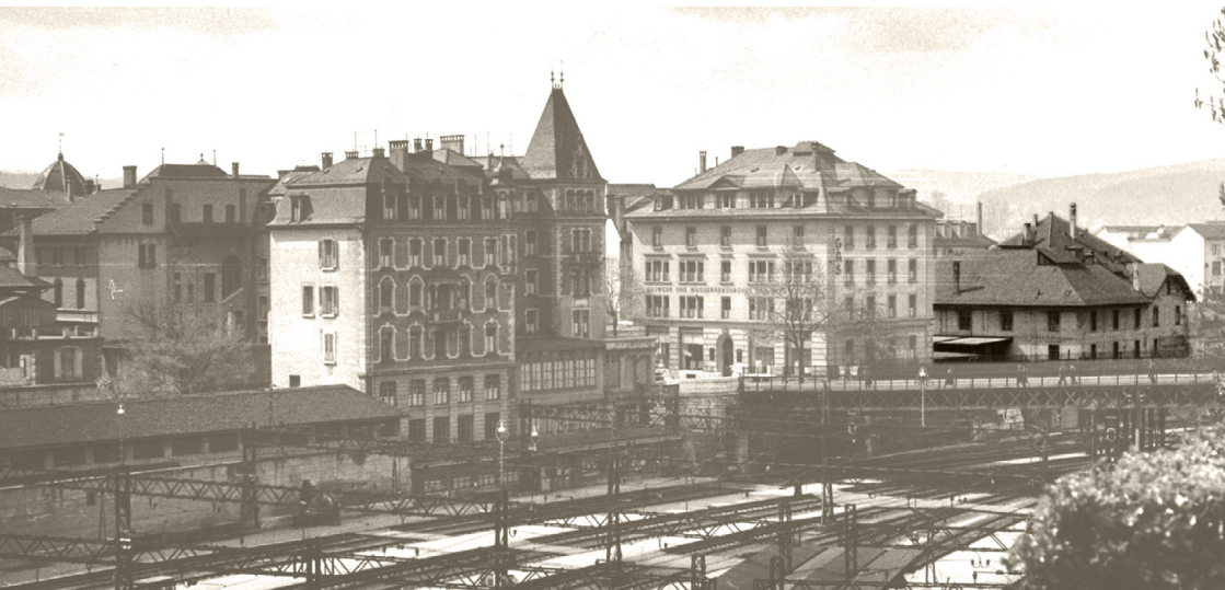
Die Schul- und Büromaterialverwaltung bezog 1919 Lagerräume an der Laupenstrasse 12 D; dort, wo heute die Überbauung Postparc steht.

Trotz der Widerstände stimmte der Stadtrat der Vorlage zu. Die drei Mitarbeiter des neuen Amtes – der Vorsteher, ein Magaziner und ein Kanzleigehilfe – nahmen am 1. Juni 1919 an der Laupenstrasse 12 D ihre Arbeit auf. Sie kümmerten sich fortan um den Einkauf von Schiefertafeln, Heften, Federn und Federhaltern sowie Reinigungsmitteln für die Schulen und die städtischen Verwaltungsabteilungen.