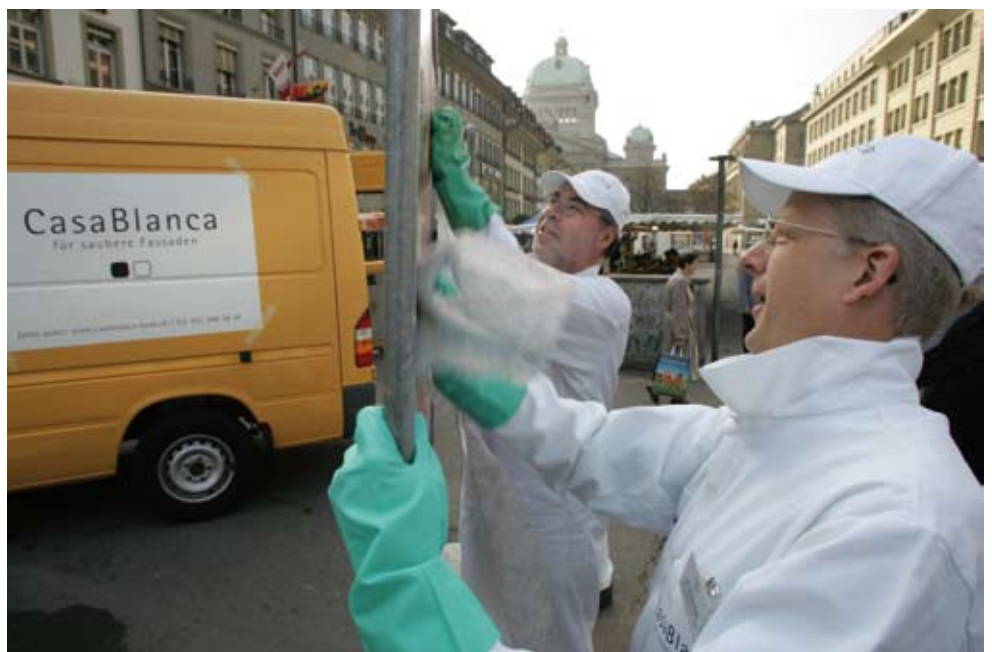
Abbildung 5: Lebensqualität = Sicherheit, Sauberkeit (CasaBlanca).

Weitere Informationen im Internet unter: www.stadtentwicklung.bern.ch