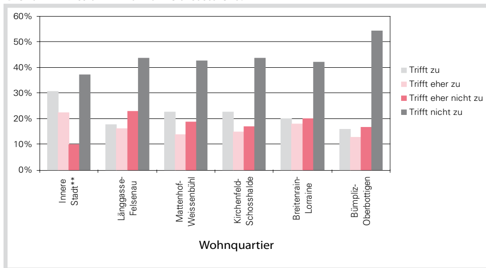
Abbildung 4: Lärm hat einen Einfluss auf die Lebensqualität (Einwohnerbefragung 2005).