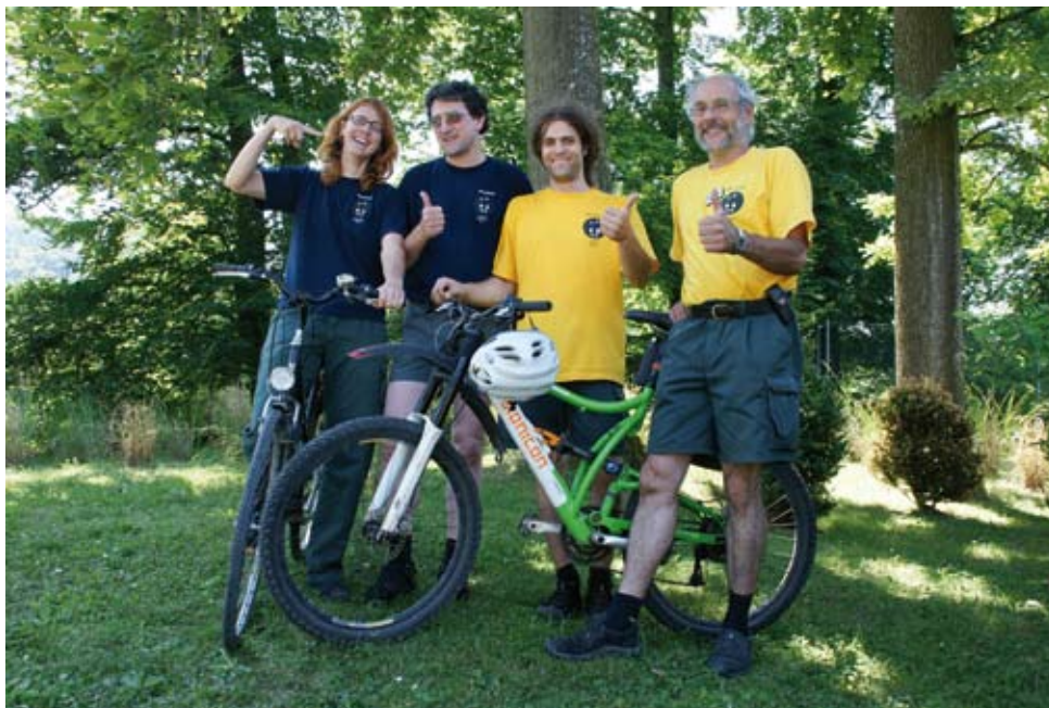
Abbildung 2: Eines von 204 Berner Teams.

ein Fussgänger, eine Inline-Skaterin oder ein Inline-Skater etc. mitmachen. Weder Kälte, regnerische Witterung noch sommerliche Hitze hinderten die Teams daran, im Juni 2008 während durchschnittlich 14 Tagen jeweils 11 km auf dem Velo zurück zu legen. Das sind pro Person und Monat immerhin 154