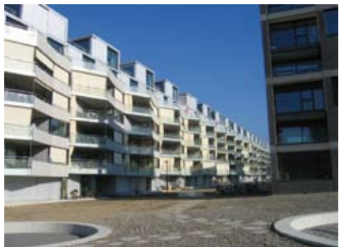
Beispiele für Wettbewerbsprojekte: Wander-Areal (vor 10 Jahren fertiggestellt), Überbauung Westpark (im Bau), Weissenstein Hardeggerstrasse (längstes Wohnhaus der Stadt, gerade fertiggebaut).