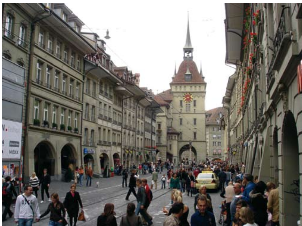
Abbildung 1: Lebensqualität = Leben, Impulse (Marktstrasse).

Eine Stadt ist dann als Wohnort attraktiv, wenn neben dem vielfältigen und ausgewogenen Wohnungsangebot auch das Wohnumfeld von hoher Qualität ist. Dann vermag sie Menschen dauerhaft an sich zu binden und neue Personen zusätzlich anzuziehen. Insbesondere für Familien mit Kindern, aber auch für ältere Menschen sind gut erreichbare Naherholungs- und Grünräume von grosser Bedeutung. Deshalb legte der