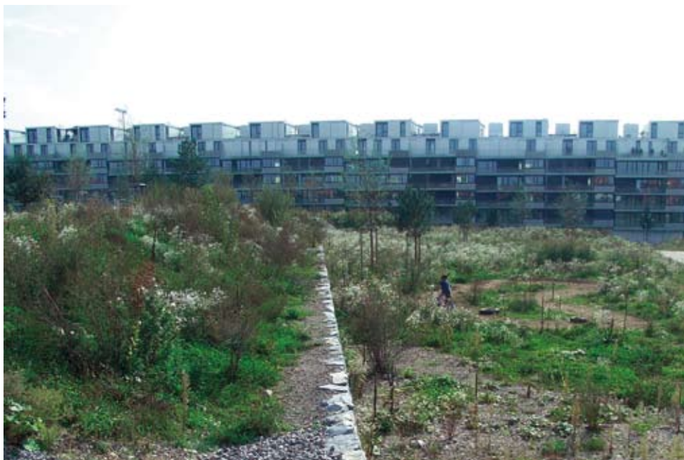
Abbildung 2: Lebensqualität = Wohnraum in der Stadt (Weissensteinpark).

Ursprünglich hatte sich der Gemeinderat in seinen Legislaturrichtlinien das