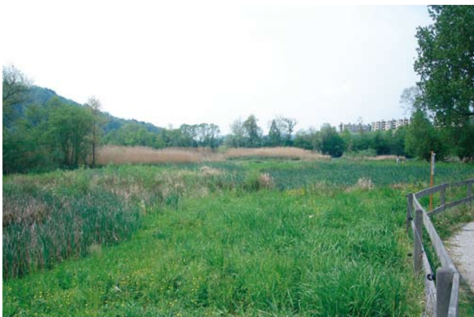
Abbildung 3: Lebensqualität = intakte Naherholungsgebiete (Gäbelbachtal).