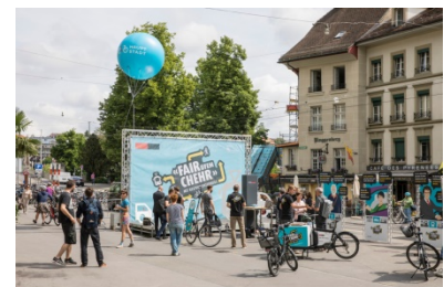
«FAIR ufem CHEHR»

Die Impressionen spiegeln die Stossrichtung der Stadt Bern wieder, den Veloverkehr directionsübergreifend zu fördern. Die weiteren bereits umgesetzten Massnahmen sind in der Präsentation zur Veranstaltung zu finden.