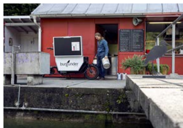
«Mir sattlä um!»